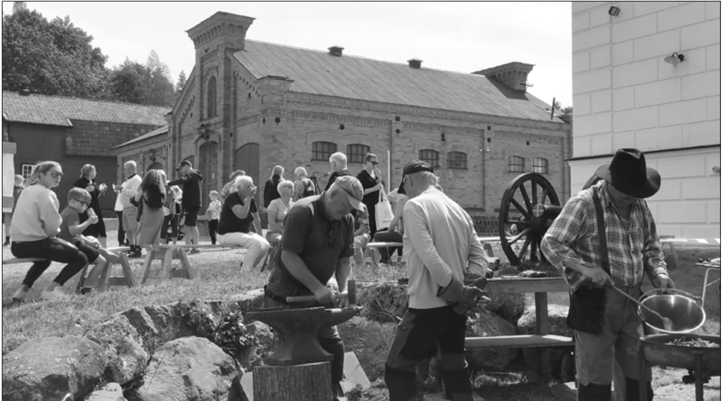
Smeder i arbete.