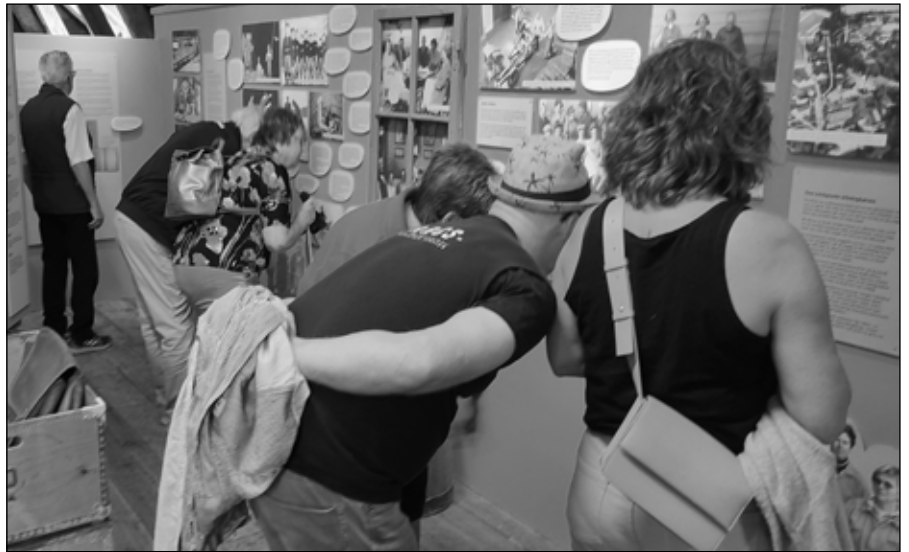
Intresset för den nya utställningen om Krutbruket i Bruksmuseet var stort från besökarna.

Bruksanvisningens redaktionsråd består av Sten Hellgren, Tomas Larsson och Pelle Johansson. Omslagsbild: Ett myllrande folkliv utanför museet på Museets dag den 27 maj, förevigat av hem- bygdsföreningens ordförande, tillika fotograf Nils Danielsson.