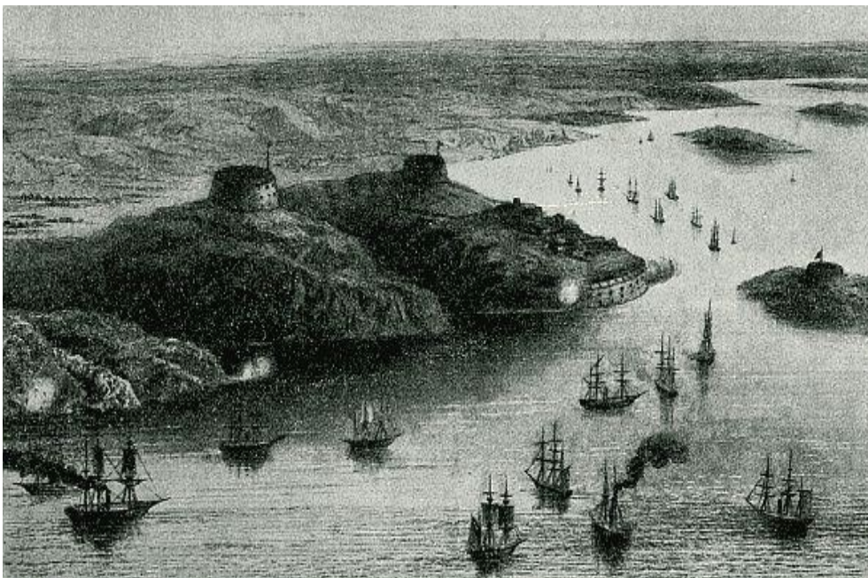
De allierade flottorna framför Bomarsund.

Bomarsunds fästning var færdigbyggd till endast c:a 1/5 och bemannades av endast c:a 1 200 man. Den ryska flottan, som f ö saknade ångdrivna fartyg, höll sig borta pga. fiendens överlägsenhet. När fästningen anfölls i mitten av augusti 1854 erövrades den efter bara några dagar och sprängdes därefter.