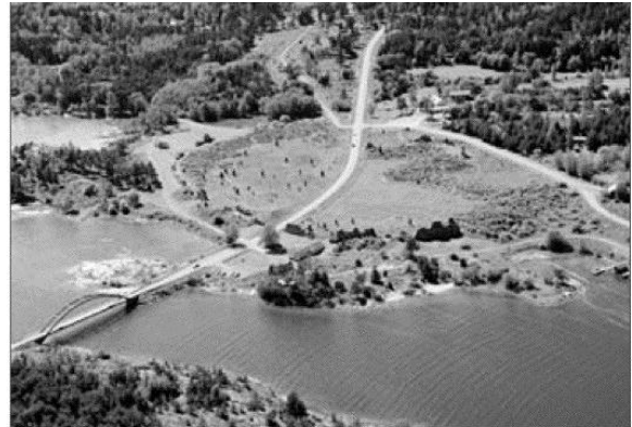
The Main Fort today.

Ovan visas bilder från G Robins: Bomarsund - Outpost of Empire. (finns på nätet, i färg).